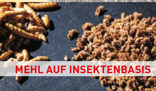
MEHL AUF INSEKTENBASIS