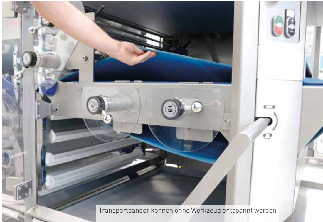
Transportbänder können ohne Werkzeug entspannt werden

Auch die Combiline plus wurde völlig neu nach dem Easy-Clean-Konzept überarbeitet und erhielt einen neuen Rahmenaufbau. Mit abgeschrägten Flächen im 45° Winkel können sich weder Mehl noch Teigreste ablagern. Alle Transportbänder sind werkzeuglos für einfache eine Reinigung entspannbar. Die Anlage bietet großzügige Bodenfreiheit von mindestens 300 mm und keine Stellfüße liegen direkt nebeneinander. Beim Design der Anlage wurde weitgehend auf Schrauben verzichtet, sondern eher auf Schweißkonstruktionen gesetzt, damit sich kein Schmutz ablagern kann. Stüpfelstation, Formstation etcetera sind in offenem Design für einfachen Zugang, die formgebenden Werkzeuge sind einfach herausnehmbar und können sauber und geschützt auf einem eigenen Aufbewahrungswagen gelagert werden. Die Maschine ist auch mit UVC-Röhren ausgestattet, um das Gehäuse und die Oberflächen zu entkeimen. Das hemmt die Schimmelbildung. Neben der