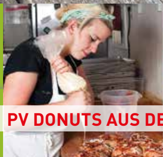
PV DONUTS AUS DEN USA