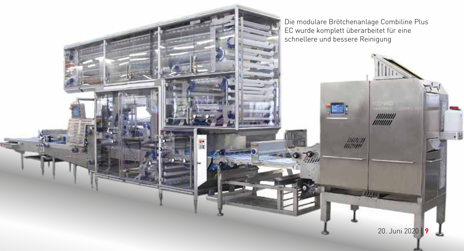
Die modulare Brötchenanlage Combiline Plus EC wurde komplett überarbeitet für eine schnellere und bessere Reinigung

hohen Vielseitigkeit für verschiedene Brötchen, wie Schnittbrötchen, Schrippen, Kaiserbrötchen, Hamburger, Hot Dog und Rosenbrötchen, bietet die Combiline plus EC nun eine einfachere Reinigung und Wartung sowie einen Zugang zu allen Modulen, um Reinigungs- und Stillstandszeiten zu minimieren. Die Anlage hat eine maximale Leistung von 11.880 Brötchen pro Stunde in sechsstufiger Arbeitsweise. PR