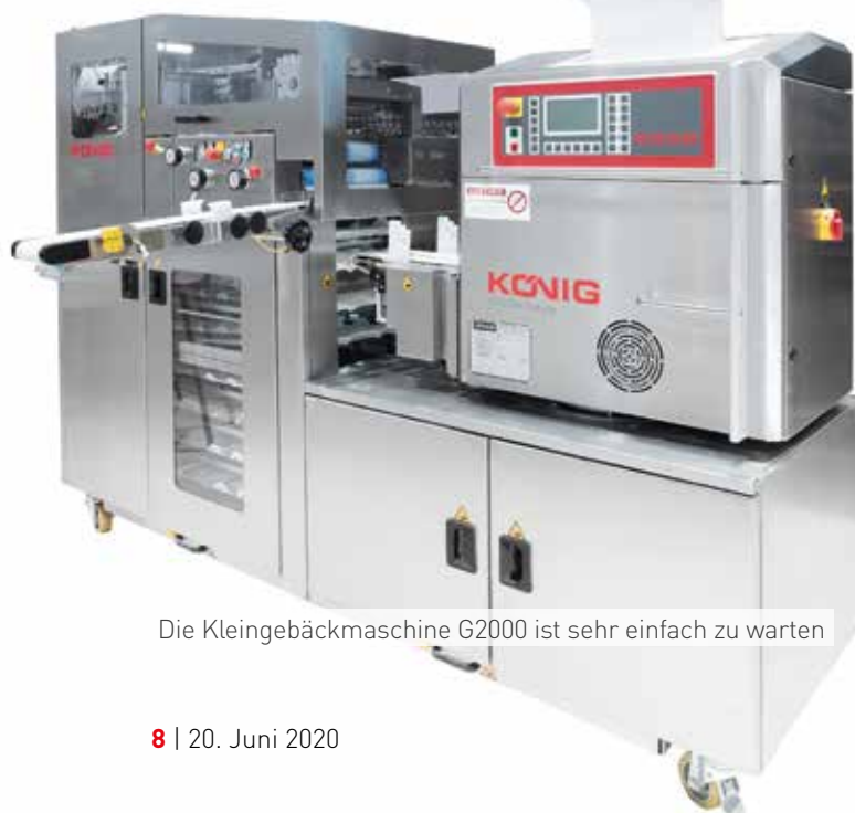
Die Kleingebäckmaschine G2000 ist sehr einfach zu warten

Die Anlage wurde überarbeitet und bietet nun das ‚Easy Clean Design‘ mit einfacher Reinigung und Wartung der Maschine, zum Beispiel durch herausnehmbare Auffangladen unter der gesamten Anlage, großzügige Bedien- und Wartungstüren in Edelstahl ausführung sowie ein benutzerfreundliches, intuitives Bedienfeld mit neuen standardisierten Bedienhebeln.