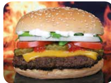
Die Kleingebäckmaschine G2000 produziert auch Buns

lage schon gestüpfelte Produkte, wie zum Beispiel Kaisersemmeln, hergestellt werden. Nun sind auch Schnittbrötchen und Hamburgerbrötchen möglich. Durch Anstellen eines kompakten König Wicklers können auch Kornspitz, Kipferl oder Salzstangerln